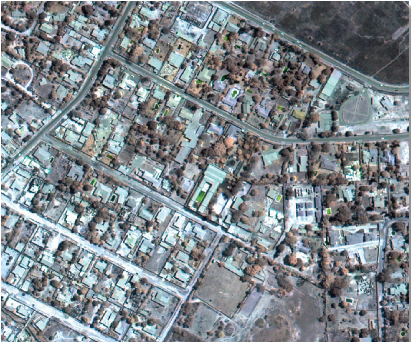
Opname van QuickBird (resolutie 50 cm) van een wijk in Lubumbashi.